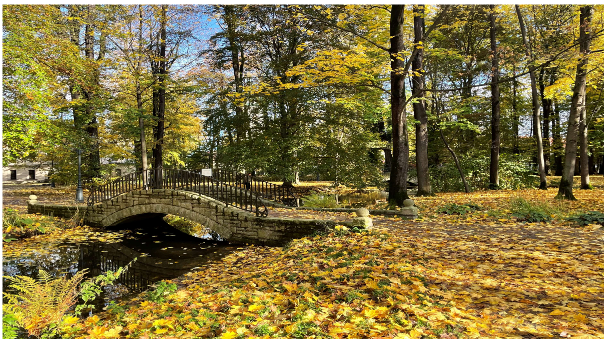
Kamienny mostek z początku XX w. wybudowany ponad kanałem parkowym