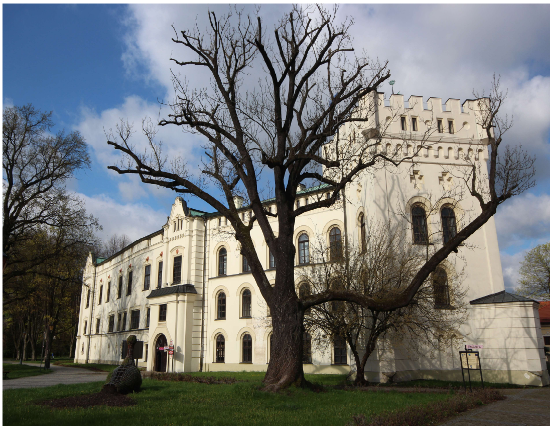
Stary Zamek w Żywcu obecnie siedziba Muzeum Miejskiego