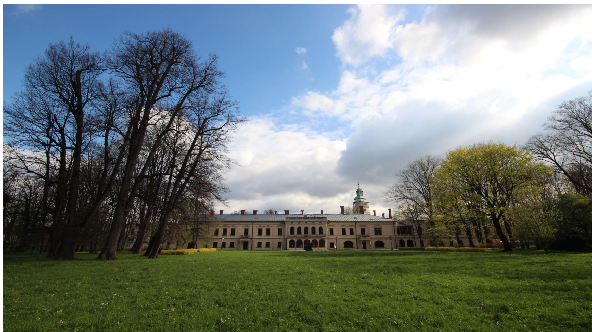
Pałac i park Habsburgów w Żywcu